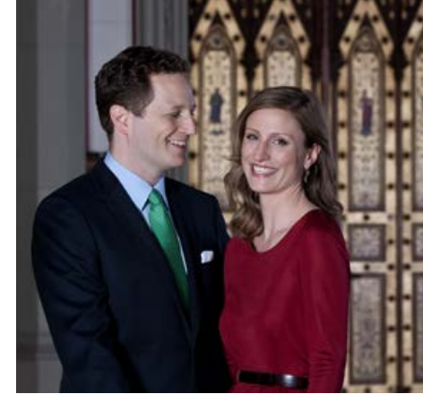
Sophie Prinzessin von Preußen mit ihrem Mann Georg Friedrich Prinz von Preußen