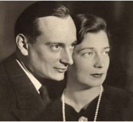
Kira Prinzessin von Preußen mit ihrem Mann Dr. Louis Ferdinand Prinz von Preußen

Im Juni 1952 gründeten Kira Prinzessin von Preußen und ihr Ehemann Dr. Louis Ferdinand Prinz von Preußen ein Jugenderholungswerk auf der Burg Hohenzollern, dem Stammsitz der Familie.